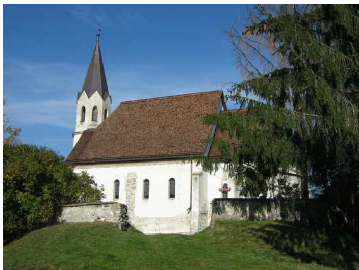
A templom helyreállított tetőzettel

Ez év áprilisában, a Hírlevél hasábjain a Hónap Műemléke rovatban már olvashattunk az abaújszántói református templomról. Az írás célja akkor az volt, hogy felhívja a figyelmet a történetileg, építészetileg