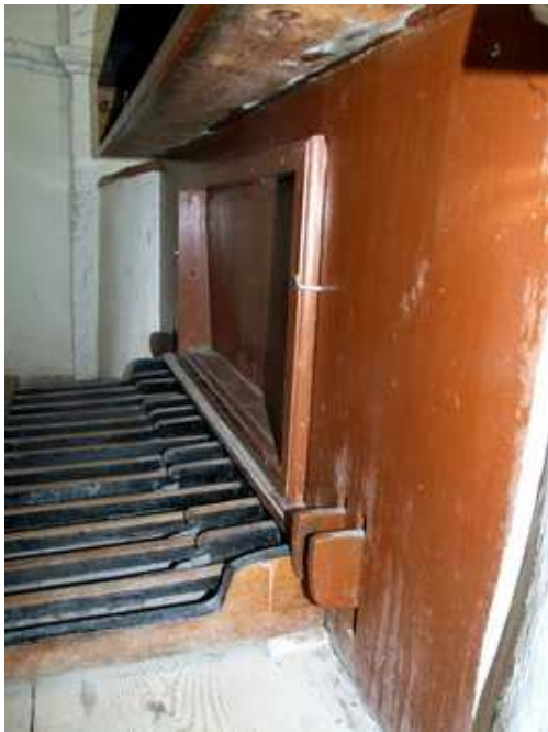
a pedálliblentyűk melletti kapcsolók a magas regisztereket kapcsolják be és ki

ragasztott előlapú, faékkal rögzített fa sípsorok: Födött 8', Fuvola 8', Fuvola 4'.