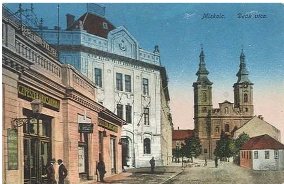
A kép Kulturális Örökségvédelmi Hivatal honlapján található ( www.koh7.hermuz.hu )