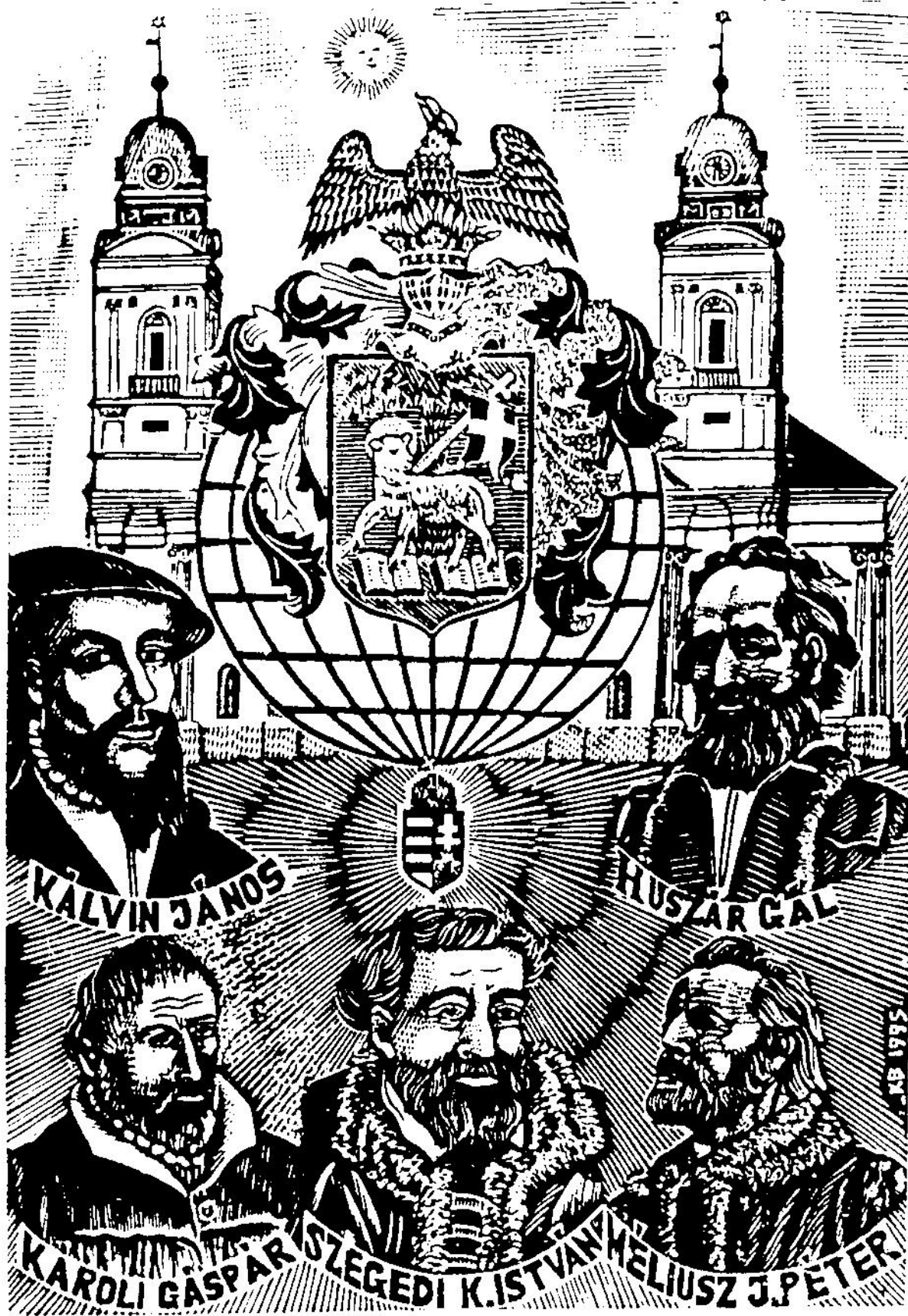
Kósa Bálint: Református pantheon (metszet)