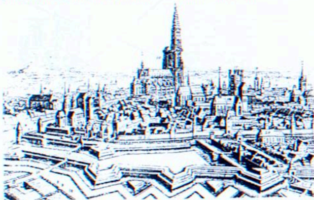
Strasbourg látképe egy korabeli metszeten