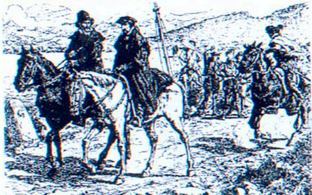
Kálvinék kiűzetése Genfből

reformációs irányzatok képviselői, bár időnként vitáztak egymással, mégis békességben éltek egymással. A város polgármestere, Sturm Jakob a reformáció pártján állt, és sokat tett az egyházzért és az iskoláért. Ellentétben Genffel, itt Kálvint megbecsüléssel fogadták, és a polgárjogot is megkapta, miután felvették a szabók céhébe. Az itteni lelképásztorok hűségesen ellátták szolgálatukat, hirdették az Igét, oktatták a fiatalokat, látogatták a család-