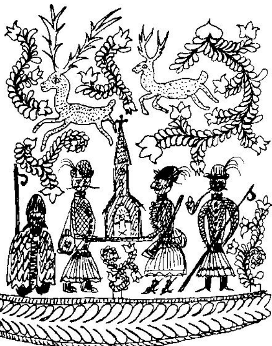
BETHLEHEMESEK - KAPÁSZKÜRT, SOMOGY-TARNÓCZA