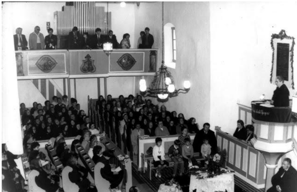
Ez a felvétel 34 éve készült templomunkban. 1980. augusztus 31-én főtiszteletű Kürti László püspök járt az egyházközségben. Ez volt a harmadik püspöklátogatás Radostyánban.