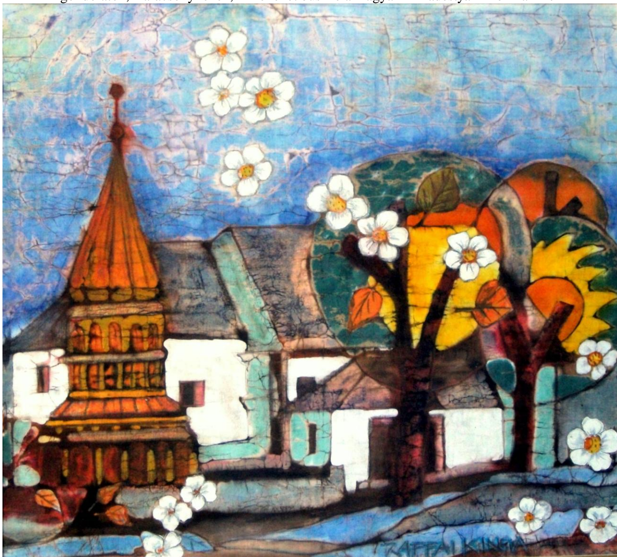
A radostyáni templom Raffai Kinga festményén

A TARTALOMBÓL: Levél az Olvasóhoz * Advent * A Kondói Egyházközség 2013. évi statisztikája * Kondói Hírnök – orgona a templomban * Gyermekünknek * Adventi várakozás * 100 éve tört ki az I. világháború * Amikor az ünnep fontosabb volt, mint a harcok * Magyar szemmel: Hétköznapi gondolatok, Karácsonyi ének, Mire lehet büszke a magyar * Radostyáni krónika-hírek