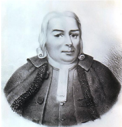
BOD PÉTER ref. lelkész, irodalomtörténész 1712-1769.

Olvasandó a Bibliából: Máté 3:1-12.; Ap.Csel. 9:1-6.; Ap.Csel. 2:37b-38.