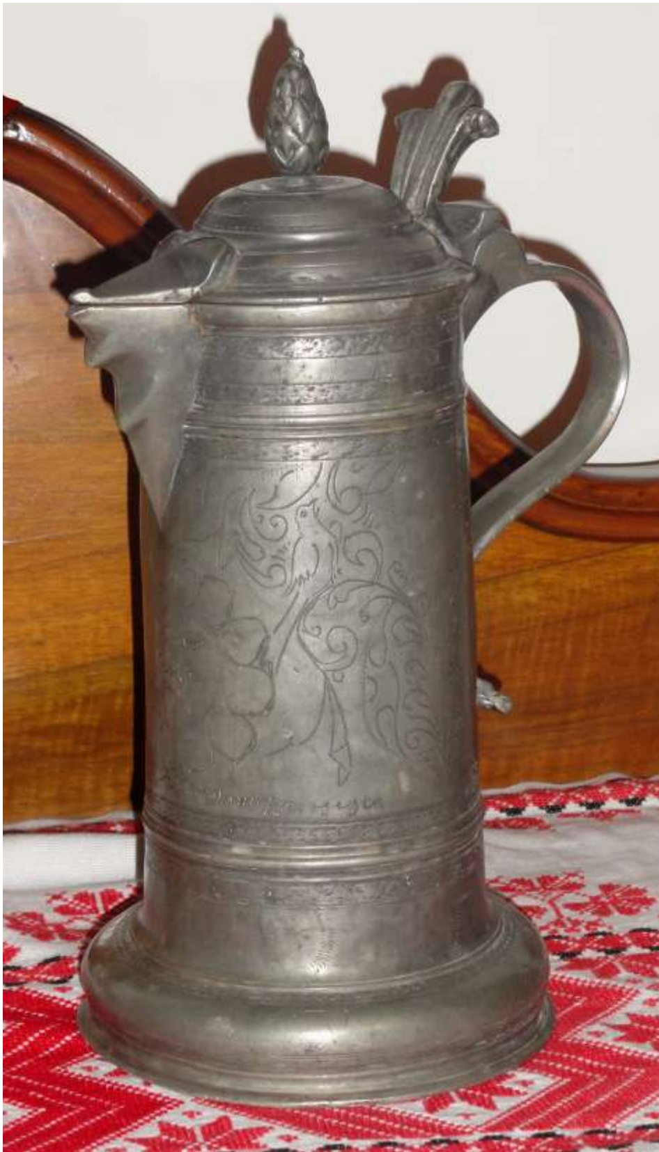
9., Az úrvacsorai ón boroskanna, felirata: