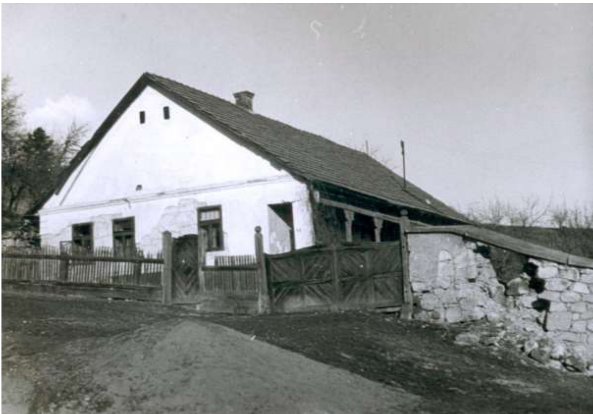
8., A régi parókia