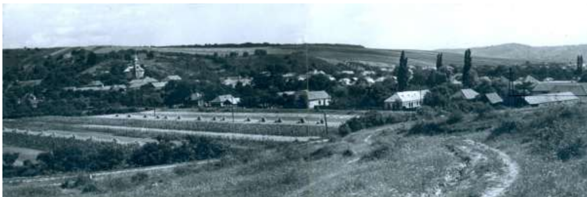
3., Falukép aratás idején