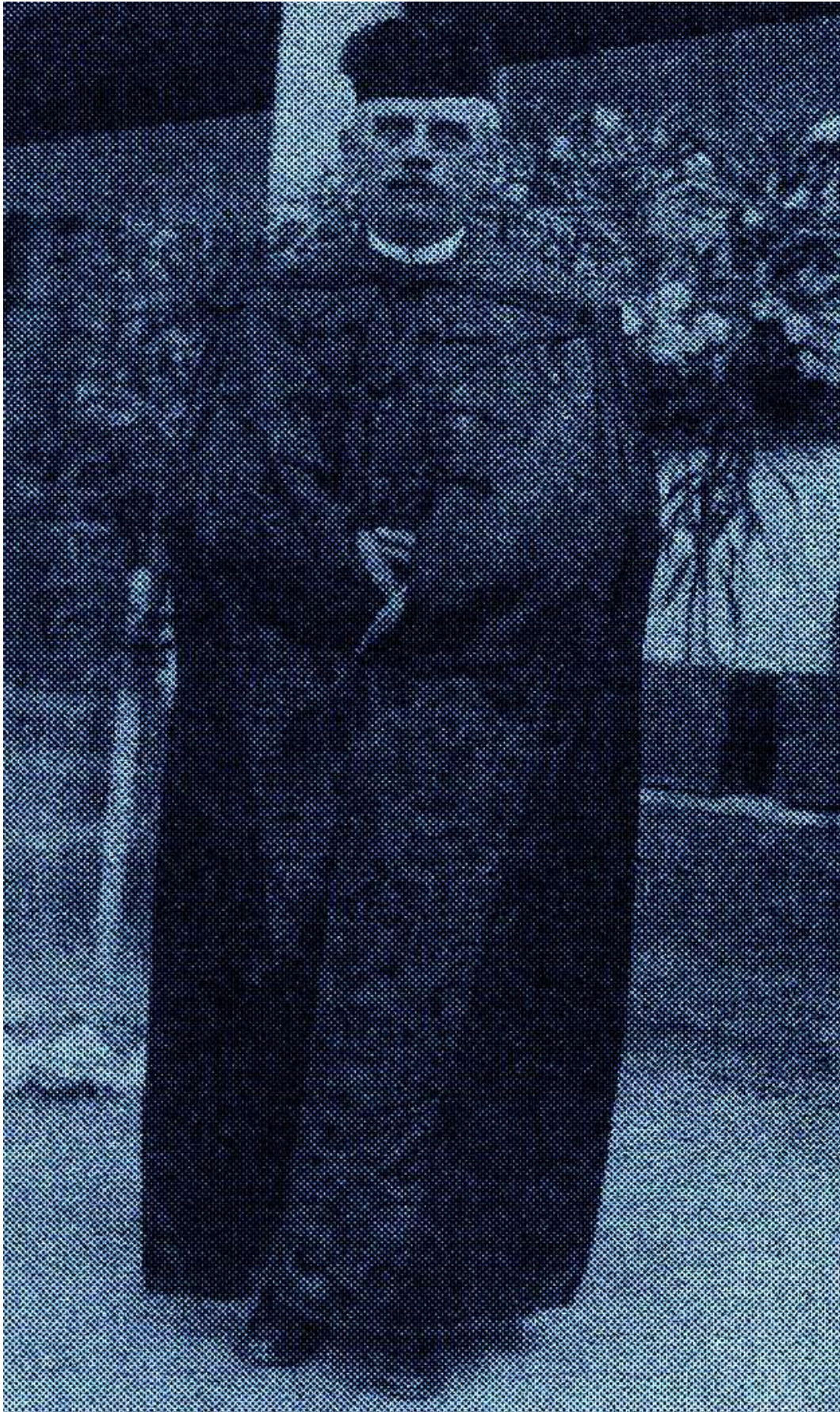
14., Borsovai Lengyel Gyula a neves irodalmár kondói lelkész fényképe