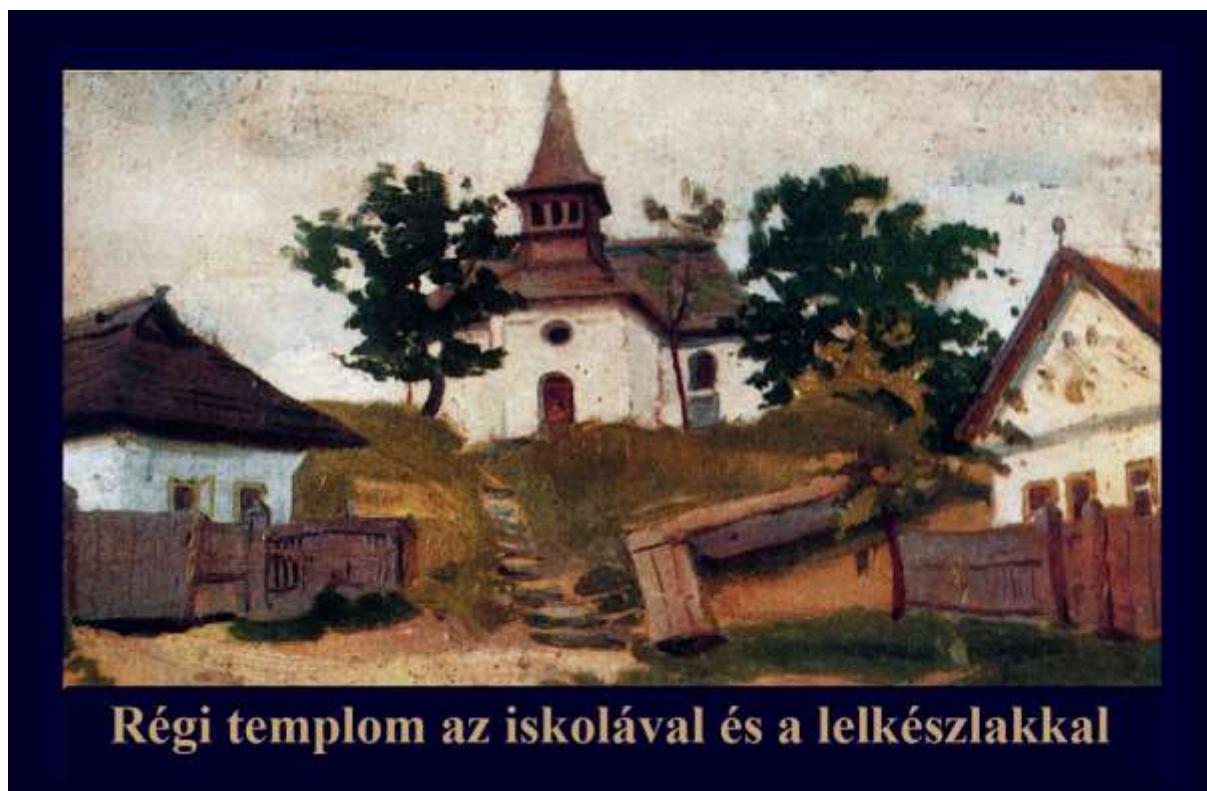
1., A XIX. századi régi templom a parókiával és az iskolával Edvi Illés Aladár festményén