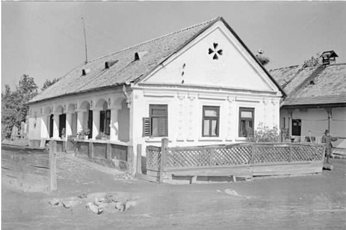
7., XIX. századi gazdaházi 1941-ben készült felvétel