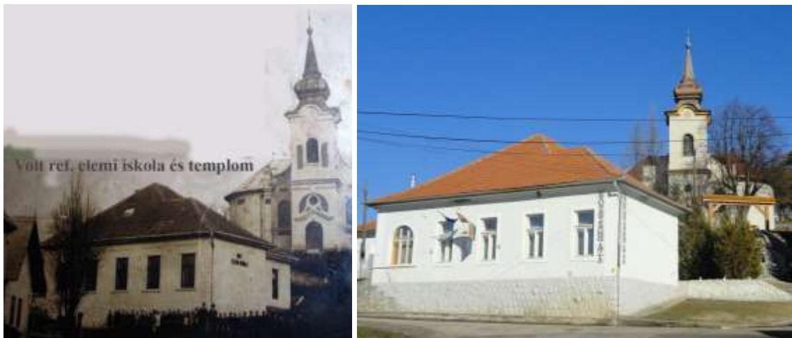
13., Református elemi népiskola és a templom régen és ma (jelenleg községháza) év nélkül