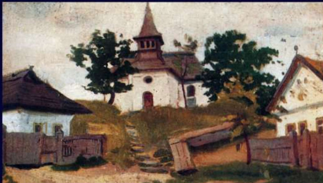
Régi templom az iskolával és a lelkészlakkal