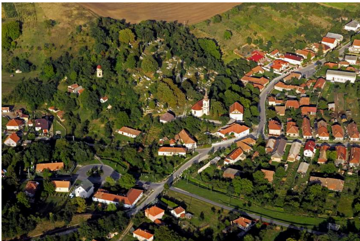
4., Légifelvétel a faluról a XXI. század elején