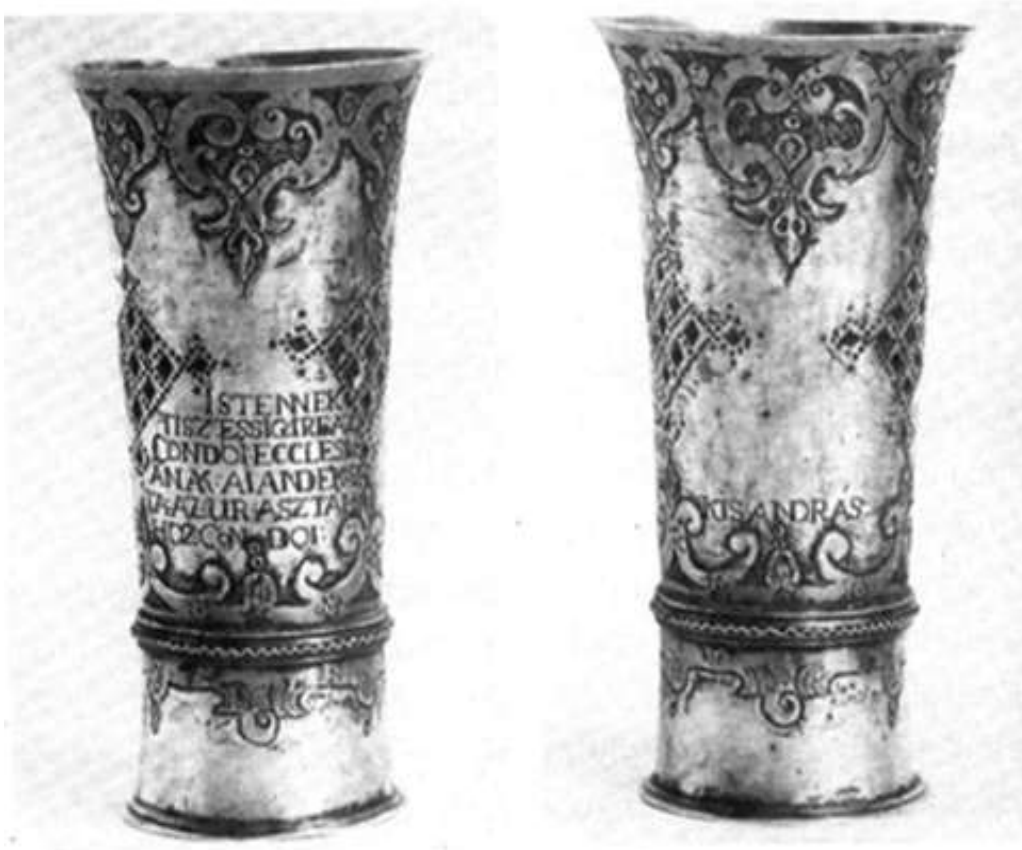
12., Régi talpas, kondói úrvacsorai pohár a Magyar Nemzeti Múzeumban, 1680 körüli magyar munka