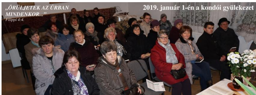
Újévi gyülekezet 2019-ben Kondón.

Az óvodai hittanórát kedden délelőtt fél 11 órától tartjuk.