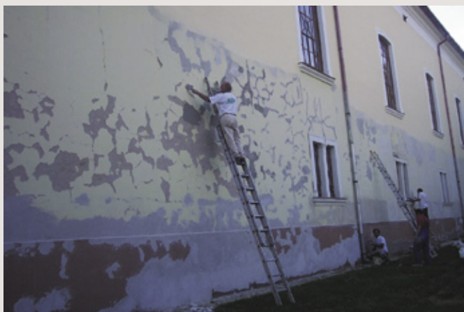
A templom külsejének renoválása