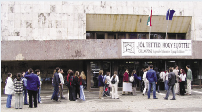
A nagyszabású rendezvénynek a Miskolc Városi Sportcsarnok adott helyet

E zer fiatal a Sportcsarnokban. Legidősebb fiatalunk nyolcvan éves, a legtöbbben mégis a tizenöt-huszonöt közötti korosztályt képviselik. Reggel nyolctól folyamatosan érkezünk: ki busszal, ki vonattal, ki autóval. Sokan, sokfelől. A belépőket szokatlan látvány fogadja, színpad a csarnok közepén, reflektorok, óriási hangfalak, mikrofonok, hangszerek. A háttérben terített asztalok sora jelzi, hogy egész napos programra készülhetünk, a karzaton izgott pakolás, járkálás: lassan összeáll a Lehetőségek Piac, mely egész nap várja az érdeklődőket. Szinte minden református intézmény képviselti magát: iskolák, szeretetotthonok, de megismerkedhettünk cserkészekkel, szociális intézmé-