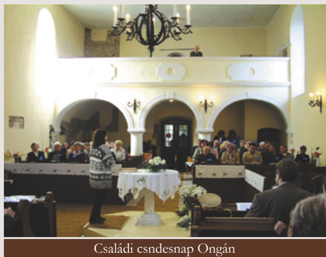
Családi csendesnap Ongán

Sajnos azokat a napokat éljük, amikor a családok többsége válságban van. Egyre több gyermeket látunk, akik menekülnek otthonról, vagy a televízió hamis világából próbálnak tájékozódni és megoldást keresni a saját, kicsi életük nehézségeire. Nemcsak a szülők nyílt harca hat mérgezően a gyermekekre, hanem az elfojtott, s a gyermek elől gondosan eltitkolt nehézségek is.