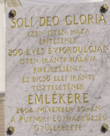
A leleplezett emléktábla

A templomtól a város főterén át a temetőig elvezető útvonalon eltöltött percek alatt – élénkítő, pihentető séta után – a putnoki