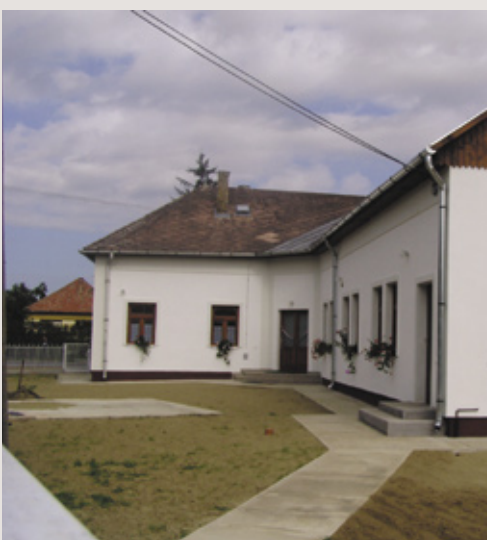
A művészeti iskolának helyet adó épület

„Nemcsak az Egervölgyi Református Egyházmegye, Átány Község Önkormányzata is támogatta az iskolaalapítás gondolatát azzal, hogy használatra átadott az egyházmegyének egy, a falu központjában, a templom és a parókia tőszomszédságában levő épületet. Az egyházmegye felújította, kibővítette az épületet, így az I. ütemben lét-