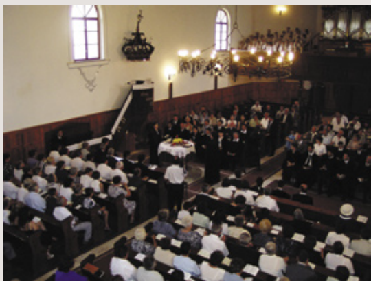
Az ünneplő gönci gyülekezet

Vannak napok, mind az ember, mind egy-egy gyülekezet életében, melyek hosszú időre emlékezetesek maradnak. Vannak napok azonban, melyeket nem csak az emlékezés őriz, mert többek egyszerű emlékeknél, maguk határozzák meg az eljövendő holnapot. Ezekkel a sorokkal egy ilyen napra emlékezem.