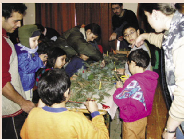
A Magyar Ökumenikus Segélyszervezet már működő programja Olaszliszván

tásairól hallottunk, majd az előítéletekességéről általában, és ami szintén nagyon fontos: saját előítéleteinkről is elgondolkodtunk. A kérdést természetesen meg is fordítottuk, és megismerkedhettünk a cigányság magyarokkal szembeni előítéleteivel, melyeknek az információkon túl sokkal mélyebb tanulsága is volt: már a legkisebbek is érzik (itt nem azokra gondolok, akik valamilyen haszonszerzés kedvéért már korán megtanul-