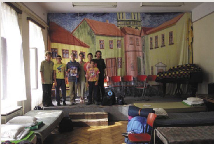
Helyzetű gyermekek látott vendégül a gyülekezet

Július 30. Háromnapos gyülekezeti kirándulásra indultak a pataki reformátusok a Dunántúlra. Az út fo-