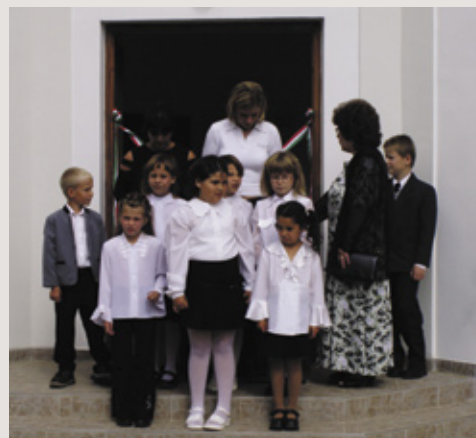
Az átányi művészeti iskola első osztálya