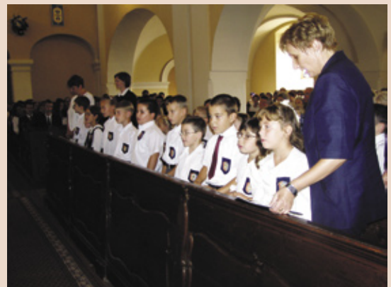
Az általános iskolások rövid műsora

A tanárok számára is üze-netet hordoz az olvasott ige. A tanári munka felelősségé-re, nagyszerűségé-re is utal. Ho-gyan is hangzik a szent parancs? „Menjete el, te-gyetek tanítvá-