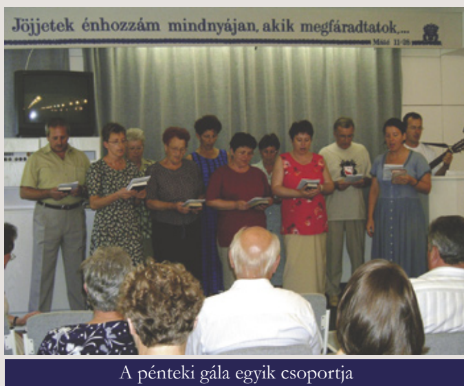
A pénteki gála egyik csoportja