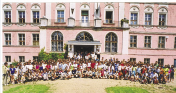
A 2004-es nyári konferenci második hetének résztvevői

séges, szeretetteljes kapcsolatunk a családdal, a barátokkal. Reméljük, sikerült a fiatal lelkekben felébreszteni, megerősíteni az erre való készséget.