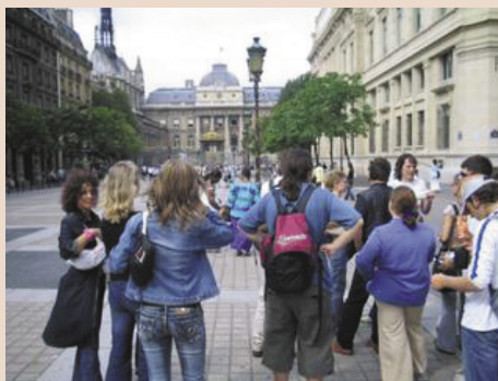
Pillanatkép a kirándulásról

mai napig ezekben az épületekben vannak a város nevezetes intézményei (múzeumok, akadémia, egyetemek). Érdekes, hogy Strasbourgban a porosz uralomig (1871-ig) nem volt teljes a közművesítés; ekkor vezették be „minden lakóház minden emeletére” a víz- és gázszolgáltatást. Majd az európai főváros acélvázas palotáinak negyedét is láthattuk. Itt található többek között az Európai Unió parlamentje, az Emberi Jogok Nemzetközi Bírósága és az Európa Tanács épülete. Másnap szakszerű idegenvezetéssel néztük meg a várost, s jártunk a Rohan-palotában, mely az egyik helyi arisztokrata család tulajdona volt 1789-ig.