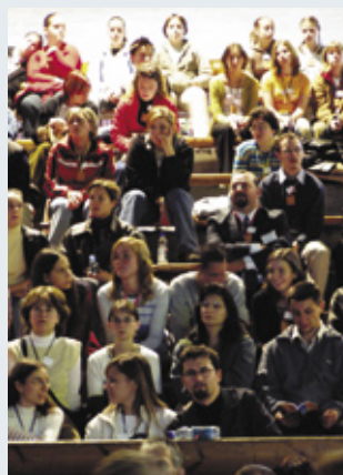
A Sportsarnokban nem sok hely maradt üresen