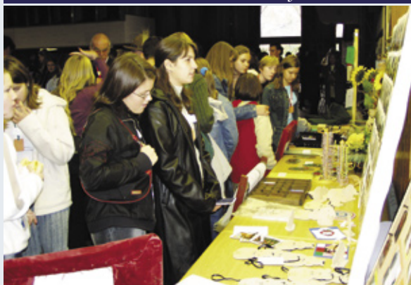
A lehetőségek piaca is gazdag volt kiállítóknak és érdeklődőkben is