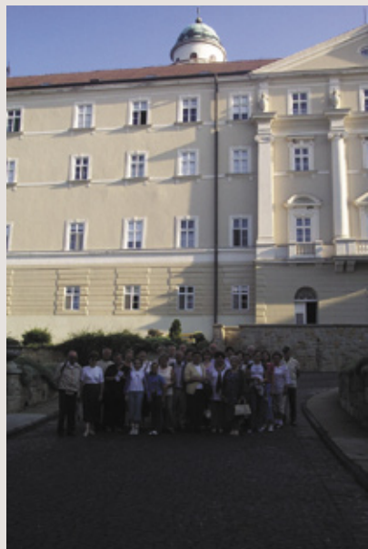
Gyülekezeti kirándulás Dunántúlra