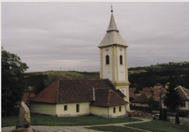
A sajobányi templom

Szeptember utolsó vasárnapján délután 2 órára hálaadásra hívtak és szóltak a harangok. A meghívott vendégek, a gyülekezet tagjai örömmel jelentek meg Isten házában, szépen felújított templomában. Régi vágyuk és óhajuk teljesült a gyülekezet tagjainak, amikor augusztus elején elkezdődött a templom belső felújítása. A mindenható Isten erőt adott, anyagi segítséget teremtett az emberek szívében, hiszen amikor elindultunk, nem is gondoltuk, hogy a nagyközség lakói és az önkormányzat ilyen segítőkészek. Először csak a falat szerettük volna szigeteltetni, de utána az emberek összefogásának köszönhetően a padokat és az orgonát is felújítottuk. Az ünnepi istentisztelet a gyermekek szavalatával kezdődött el. Az igeszolgálatot Fukk Lóránt egyházmegyei főjegyző végezte a Péter első levele második részének 5-