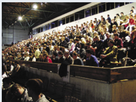
Mintegy ezer fiatal vett részt a miskolci regionális csillagponton