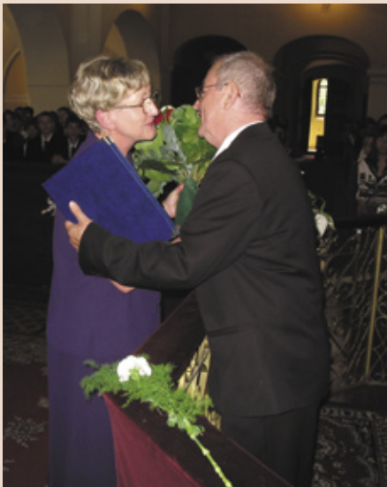
A díjátadás pillanatai

ményünkben töltötte életét gyermekkorától kezdve.