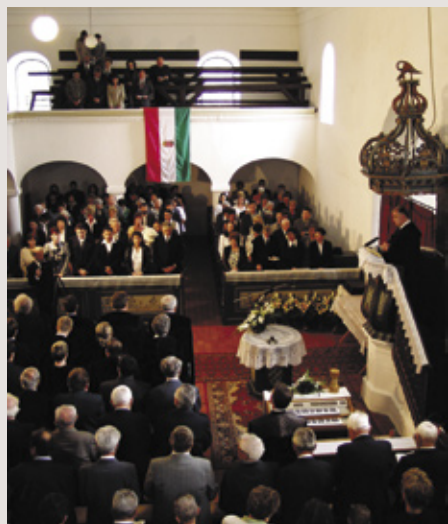
Ünnepi istentisztelet az átányi templomban