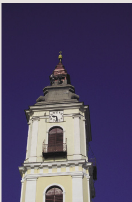
A templom siskaja is megújult

lyamán meglátogatták a veszprémi érseki palotát, a pannonhalmi apátságot, a fertői Eszterházy kastélyt, a nagycenki Szécheny kúriát. Sétát tettek Sopron történelmi belvárosában, felüdültek Bükfürdő vizében, valamint bejárták Pápa