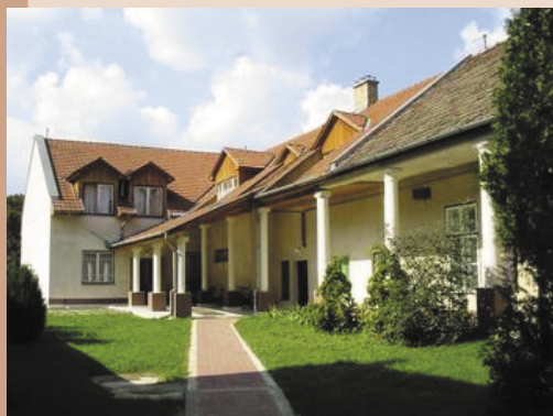
Az iskoának helyet adó épület

A Sárospataki Református Kollégium Gimnáziuma a város legrégebbi, legráteremtettebb oktatási intézménye. 1531-ben Isten kegyelméből protestáns iskola született gróf