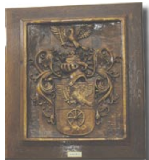
Rákóczi család címere