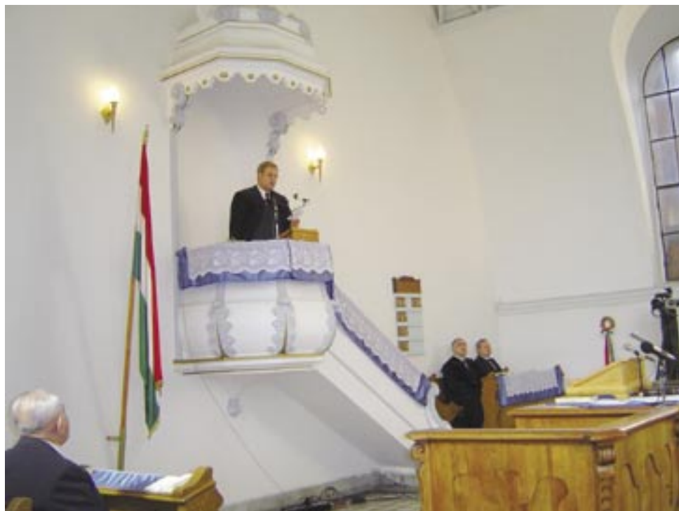
Tőkés László püspök az egri református templom színpékén