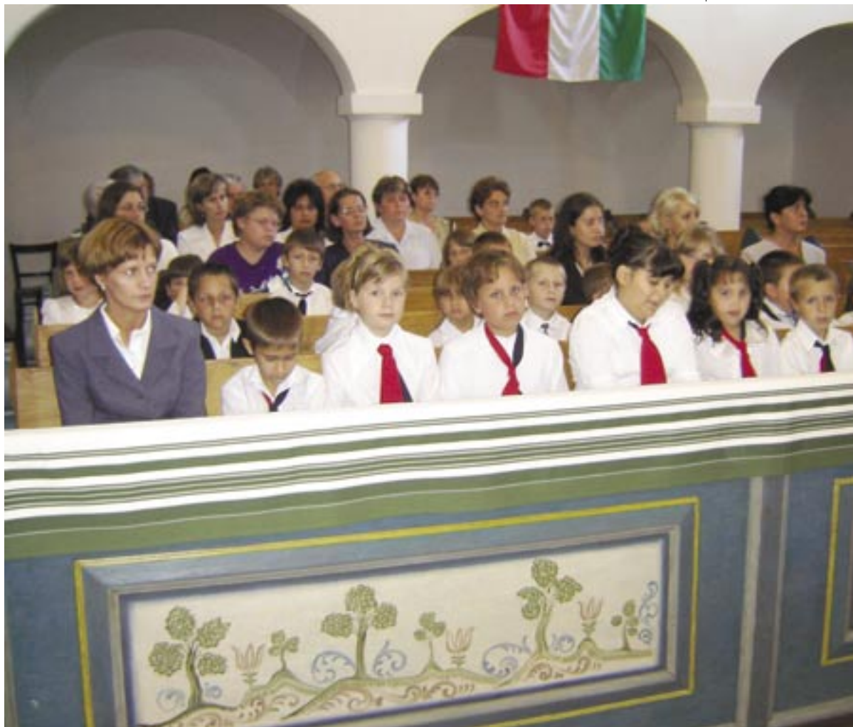
Tanévnyitó az átányi református templomban