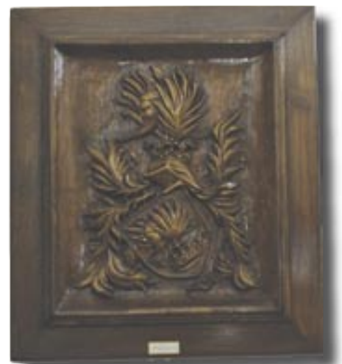
Perényi család címere