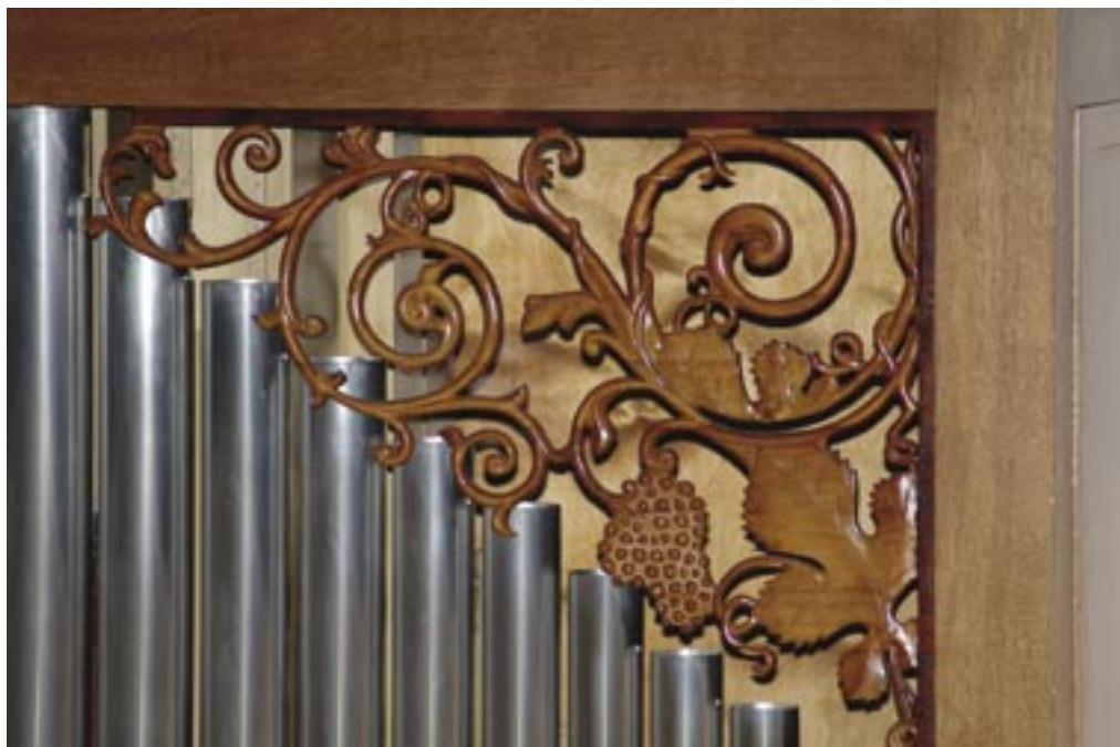
A Kollégium imatermi orgonájának betétlapja