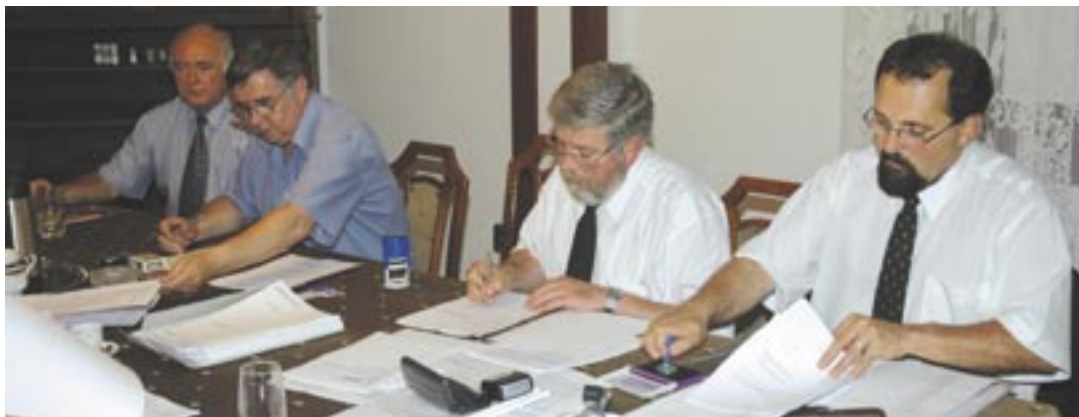
A rádió megvásárlásáról szóló szerződés aláírásának pillanatai

„...Azt gondolom, hogy az a körülmény, hogy most eljutottunk hosszú-hosszú évtizedek után oda, hogy van egy olyan rádió, mely a református egyház tulajdonába került, valóban sokaknak az álmát sikerült ezzel, Istennek a kegyelméből beteljesíteni. Hogy csak egyet említsek, a XX. század első harmadának kiváló, nagyon egyéni, egyedi tehetségű professzora, Csikes Sándor a század elején a '20-as, '30-as években református rádióról álmodott. Az Isten megadta azt a lehetőséget, hogy most ide elérkezzünk, és elérkeztünk. Valóban az lehet, hogy ez egy különös egybeesés, vagy az Isten kegyelmének, gondviselésének a munkája. Ez az esztendő lehet, hogy úgy fog bevonulni a Tiszáninenni és a Tiszántúli Egyházkerület történetébe, hogy valami olyasmit csináltunk, amit eddig még sosem. Mert mi Tiszántúlon, Debrecenben vettünk egy templomot, itt Miskolcon meg közösen vettünk egy rádiót. Tettük ezt azért, hogy élve az egyházkerület által elindított kezdeményezéssel, elinduljunk azon az úton, amelynek nem titkolt végső célja az, hogy legyen egy olyan magyar nyelvű rádióállomás, ami most jelenleg kisebb hatókörben sugároz ugyan, de szeretnénk előbb a két egyházkerület terü-