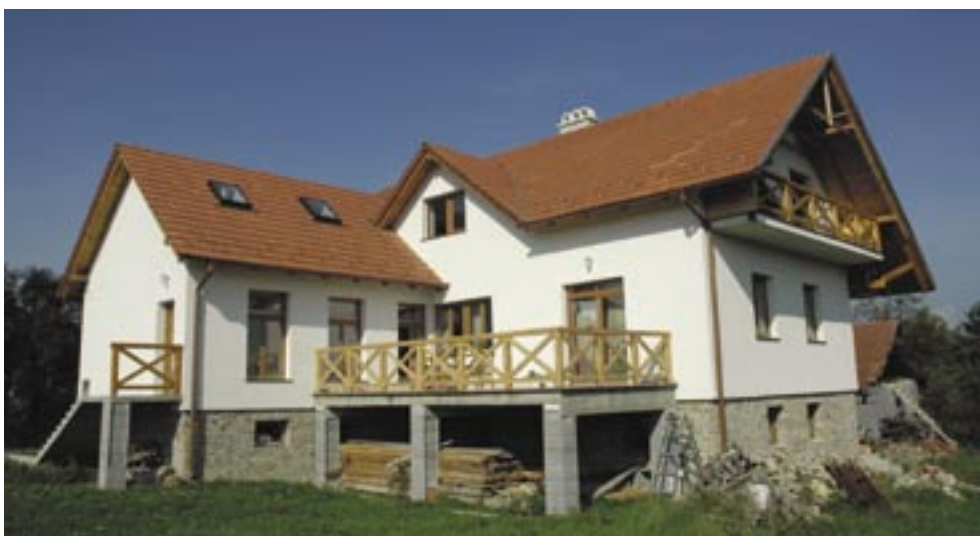
A nyíri református gyülekezet új parókiája