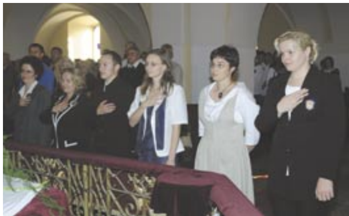
A gimnázium új tanárainak fogadalomtétele