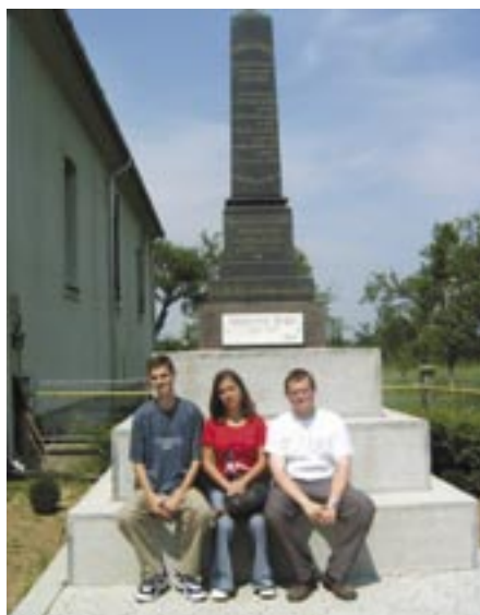
A Lévy küldöttsége:

Az idén június 13-17-ig került sor a rendezvényre, melynek mottója a következő volt: „Ti pedig választott nemzetiség, királyi papság, szent nemzet, megtartásra való