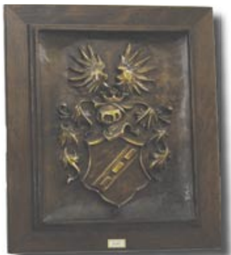
Dobó család címere

Igen, a címereket csak minta alapján szabad csinálni. A Trianon-fához azonban csak a Wass Albert idézetet kaptam, a többi saját elgondolásom. Az idézetről jutott eszembe az életfa képe. Gyökerek, erős törzs, és a lombkorona nagy Magyarország. Mert ahogyan a fa sem élhet részletekben, ugyanúgy a nemzet is csak egészében, összességében tud élni. Trianon szétszabdalta, és azt csak erősítette a decemberi népszavazás, ami azóta is nagyon felkavar, ha rá gondolok.