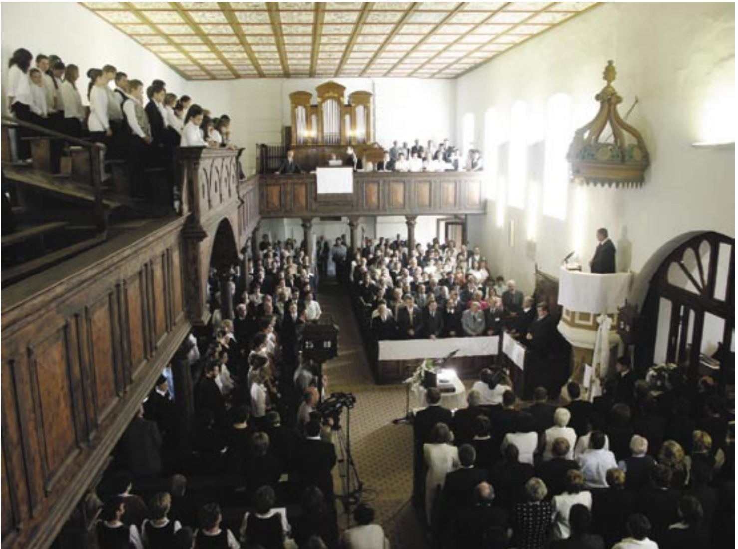
Országos tanévnyitó a mezőcsáti református templomban

De azért a református keresztyén iskolákban úton járó emberek vannak együtt, és az egész iskolai nevelés csak arról szólhat, hogy az idősebbek azt tudják mondani a rájuk bízott gyerekeknek: gyere, én megmutatom neked az utat, amelynek igazságáról meg vagyok győződve, és amelyen magam is járok.