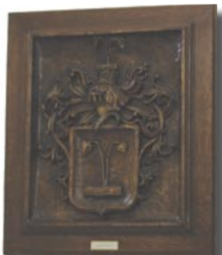
Lórántffy család címere