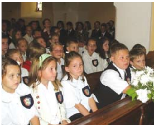
Kisdiákok a tanévnyitón