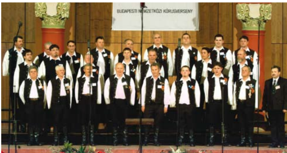
A Mezőkereszteszi Férfikórus a Budapesti Nemzetközi Kórusversenyen

zökeresztesre érkezett vendégkórusok: a felvidéki Szepsi Vox Columbella vegyeskara, a Bódvai Férfi Éneklő Csoport, a sepsiszentgyörgyi Cantus Firmus Vegyeskar, a Szerencsi Férfikar, valamint a Mezőkereszteszi Kamarakórus, a Citerazenekar és az ünnepelt Férfikórus.