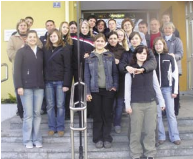
A Lévy küldöttsége és a felsőőri házigazdák

ka. Ismerkedés az igazgató úrral és a tanárokkal, majd a diákokkal, óralátogatók (ahol az órák 50 percesek, a szünetek