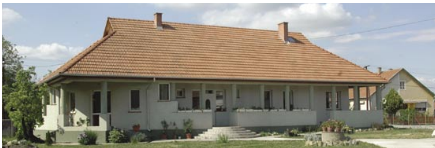
Az új parókia épülete