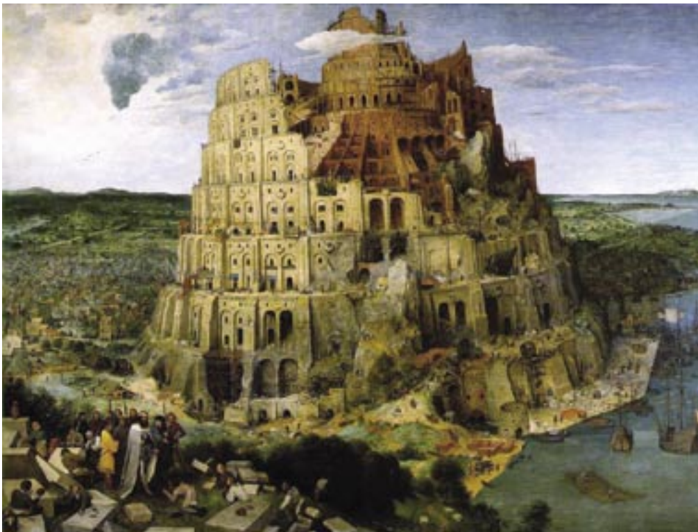
Pieter Brughel (1525?-1569): Babel tornya

emberek között a földön, hogy különböző nyelveken beszélnek, ezt a Szentlélek ugyanis megszentelte pünkösdkor, hanem az, hogy az emberek maguk között hazudoznak. Vegyük akár a legszemélyesebb kapcsolatokat, a politikai életet, vagy az államok, népek közötti viszonylatokat: hazudoznak. Pünkösdkor a Szentlélek pedig azt mondja, hogy meghirdetem az Isten nagyszerű dolga- it, és ha ehhez kezdesz el igazodni, beszélj bár pártusul, médül, elámitául vagy arabul, akkor Istenhez igazodva a másik embert is megtalálod a maga nyelvén. Mi is, ha a mi magyar nyelvünkön beszélve Istenhez igazodunk, akkor megtaláljuk egymást is. Isten tehát nem teszi zárójelbe a nyelveket, mint a középkori egyház, amely azt gondol-