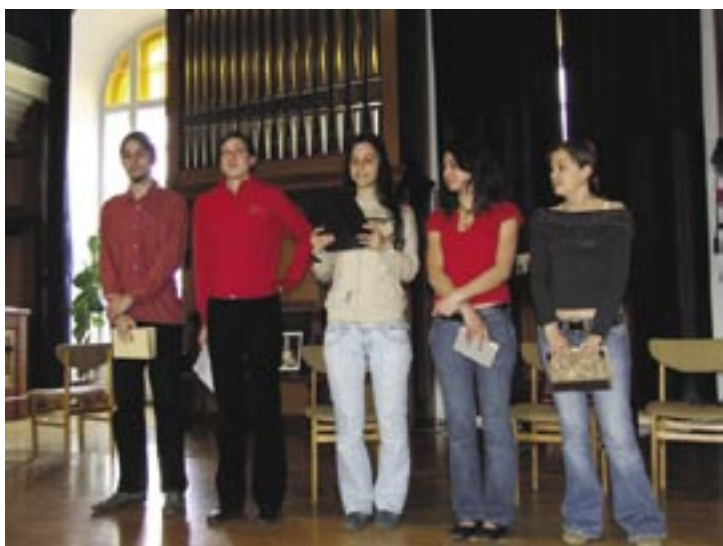
A 11. H-sok verseket olvasnak

Május második hetében a végzősökre figyel az Alma Mater. A búcsú sokszínű Patakon: hozzátartozik a kibocsátó istentisztelet – az idén Szabó Árpád lelkész, a Kossuth Internátus végzősének nevelőtanára hirdette az Igét –, az internisták számára az ünnepi vacsora a Mudrányban, a szerenád az internista lányoknak, a kiscsengetés a pénteki utolsó óráról: minden végzős megkondítja a kis harangot, mely akkor, ott csak neki szól, s bizony elfelhősödnek ilyenkor a szemek... Szép hagyomány, hogy az öregdiákok közül is sokan jönnek vissza az iskolába csak ezért a 10-12 percért.