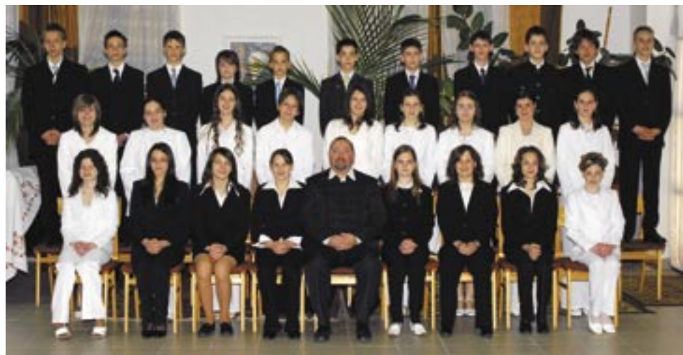
A sárospataki gyülekezet idén konfirmált fiataljai