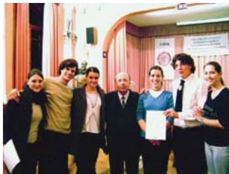
A műveltségi verseny pataki csapata

életéről és munkáiról szóló országos vetélkedősorozat nyíregyházi elődöntőjén. A csapat a műveltségi versenyen az 5. he-