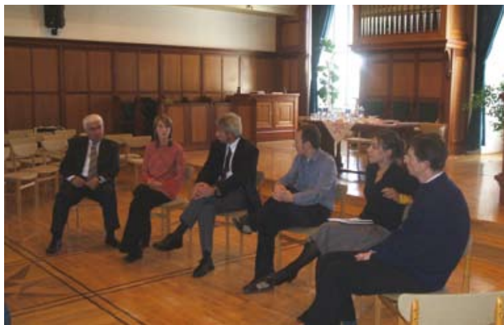
Keresztyénség és kultúra - kerekasztal beszélgetés

tőben az Anyanyelvápolók Szövetsége jutalmát vehette át.