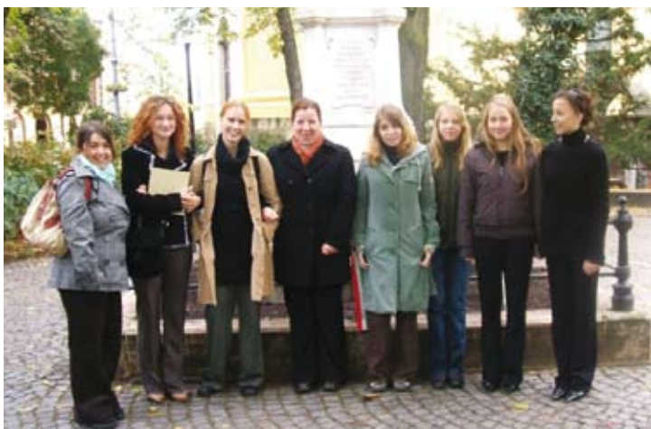
A debreceni küldöttség