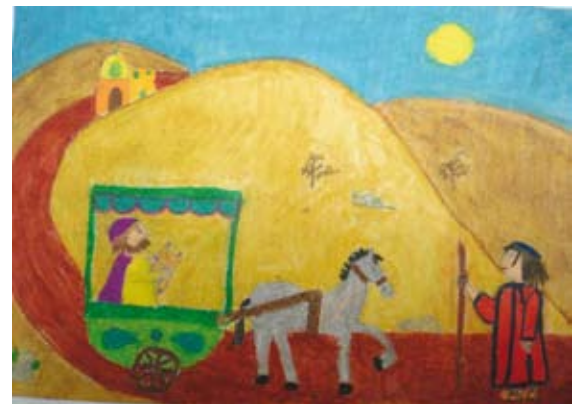
Pap Sarolta 3./a oszt. mezőcsáti refi