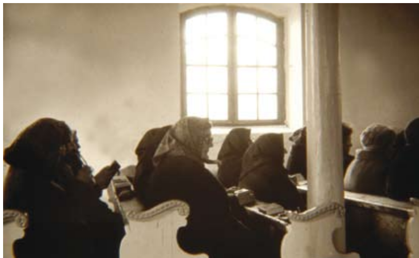
A kép csak illusztráció

ték visszanyerni a kolhozosítás előtti arculatukat, a falvakban az egyszerű, rendben tartott porták.