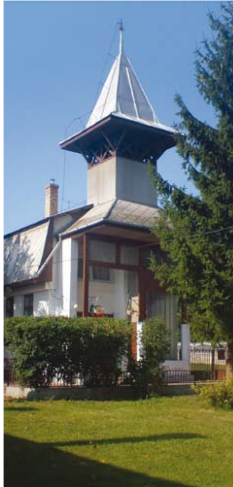
Az Ózd-Sajóvárkonyi református templom

Most, 2008 tavaszán újra egy Isten előtt kedves összefogásnak, segítőkészségnek és áldozathozatalnak lehetünk a tanúi. Az