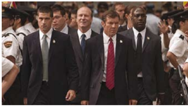
Pillanatkép a filmből

gárda jól eltalált, a legtöbbet hozták ki a lehetőségeikből, habár az is igaz, hogy a legnagyobb alakítást az a Sigourney Weaver nyújtja, aki össze-vissza 8 és fél perccel szerepel a filmben, de talán ez a nagyság átka. Szóval van itt minden, ami kell: válófélben lévő amerikai turista (Forest Whitaker), aki minden spanyol szóra csak vigyorog, de azt meggyőződéssel teszi. Mélypontról feljövő elnöki testőr (Dennis Quaid), akire mindig lehet számítani. Előzőnek barátja, és kigyúrt kollégája (Matthew Fox), a bájos mosolyú Jack bácsi a Lostból. A rossz fiúk olda-