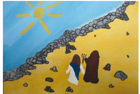
Takács Zsófia 2./b oszt. mezőcsáti refi

A templomi nyitó áhítaton a házigazda gyülekezet részéről Alexa Gábor