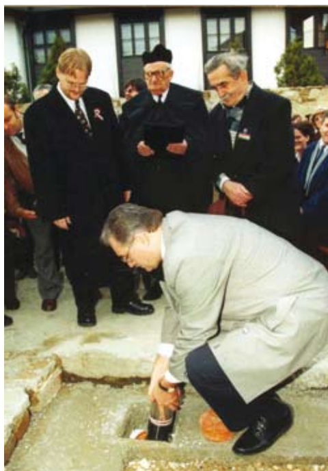
A Nyilas Misi Ház alapkövetéle

A Ház története egy alapítvány létrehozásával kezdődött egy belvárosi presbiter ötlete alapján, akitől az elnevezés is származik. Az alapítvány elsődleges céljaként diákok támogatását nevezték meg, illetve hogy „testi-lelki otthon adjon a fiatalok és gyermekek számára”. A Bor-