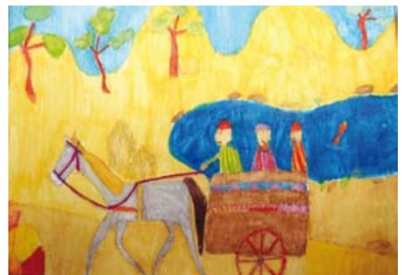
Takács Zsófia 2./b oszt. mezőcsáti refi