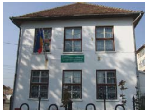
A Kézdivásárhelyi Református Kollégium