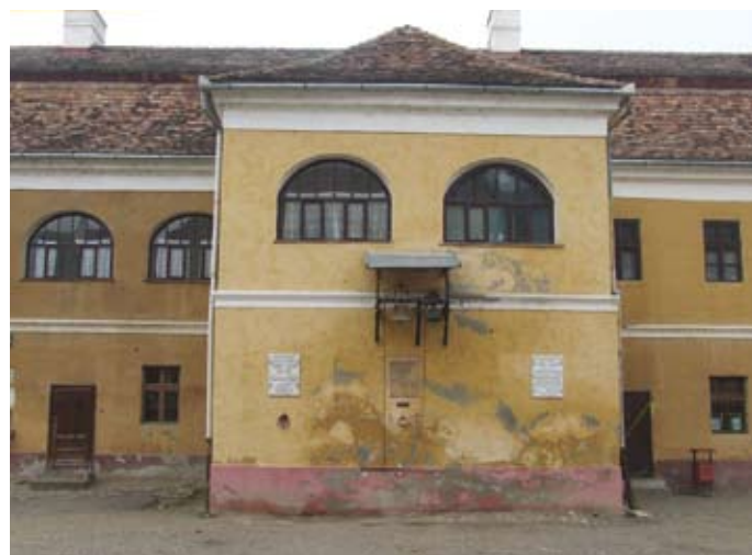
A Nagyenyedi Református Gimnázium

Szilágyi Zoltánné cserediák-program felelős