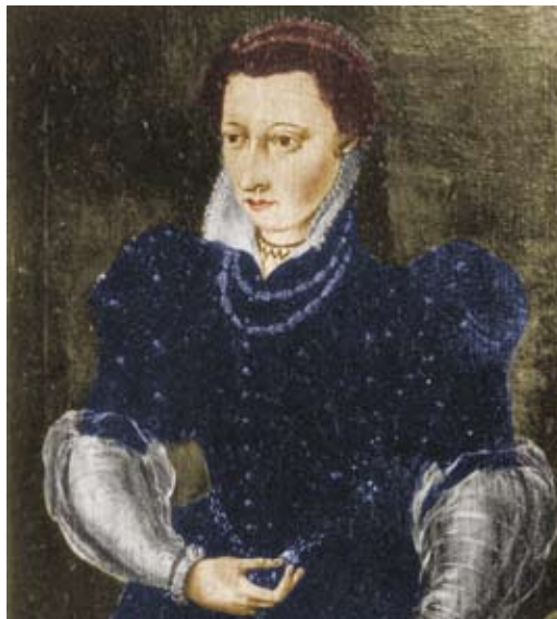
Idelette de Bure

(forrás: Révész Imre, Kálvin élete és a kálvinizmus . Debrecen, 1909)