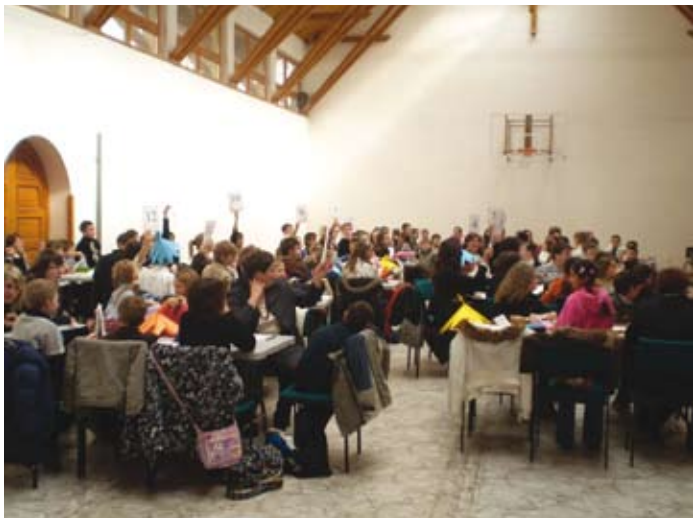
„Törd a fejed!” tehetséggondozó matematika verseny

Március 20-án a Dr. Enyedy Andor Református Általános Iskola, Óvoda és Bölcsöde hagyományainak megfelelően ebben a tanévben is megrendezték a „Törd a fejed!” tehetséggondozó matematika verseny döntőjét. E verseny célja a tanulók feladatmegoldó készségének fejlesztése, a tehetséggondozás, és a hátrányos helyzetű iskolák tehetséges tanulói számára versenylehetőség biztosítása, mivel e versenyre nevezési díj nincs. A há-