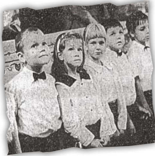
Émlyítő, 1994. szeptember 4. „az első fecskék”

E mlékeimben őrzöm azt a 15 évvel ezelőtti szeptember 4-ét, amikor a diósgyőri református templomba iskolanyitogató és tanévkezdő istentiszteletre hívtak a harangok. Egy induló 22 fős osztály kapott útravalót, felszentelő igehirdetést a Keresztelő János születése alkalmával elhangzó kérdés alapján: „vajon mi lesz ebből a gyermekből? A gyülekezet tagjai bizonytalan reménykedéssel nézték az Úr asztala körül felsorakozó piciny sereget, és bennünk is megfogalmazódott néhány kérdés. Vajon lesz-e belőlük igazi, nagy iskola, lesznek-e követőik, támogatóik, életképesek maradnak-e? A kérdések