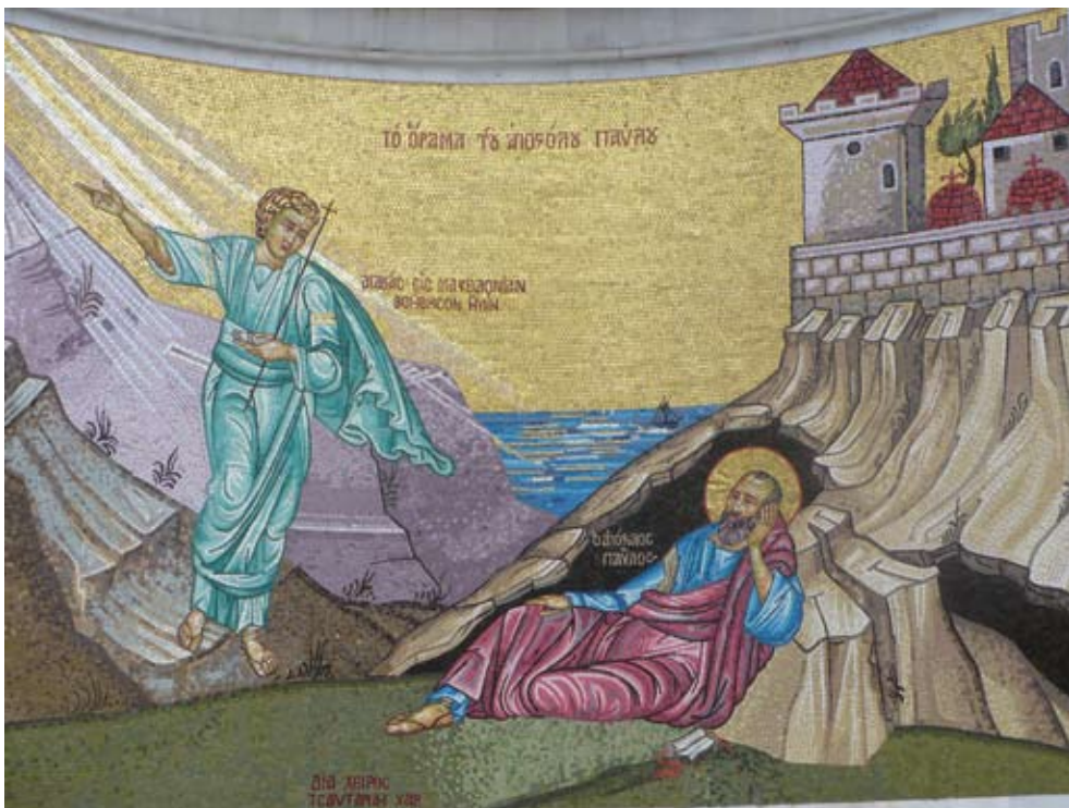
Pál apostol álma a béreai mozaikszalon

prédikál. A másik oldalon lehet látni Pál látomását Tróászban, ahogy őt egy macedón férfi segítségül hívja. Talán érdekes végiggondolni, hogy Pált éppen egy macedón ember hívja segítségül. Pál eredetileg farizeus volt, és a farizeusok egyik fő célja éppen az volt, hogy ne engedje a zsidók között a görög (hellénista) életstí-