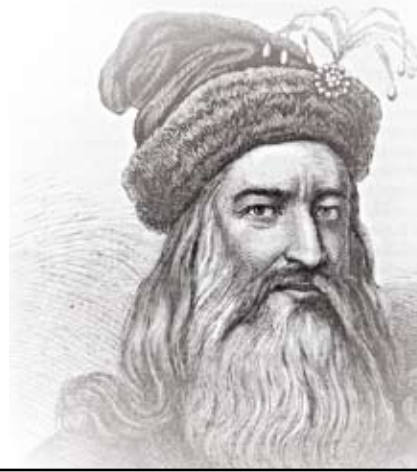
I. RÁKÓCZI GYÖRGY

„Igazán, tökéletesen szeresd mátkádat és feleségedet, de csak úgy azért, hogy ahhoz való szereteted hazádnak, nemzetednek, kiváltképpen az Isten tisztességének szeretetét feljebb ne haladja, mert ember talál feleséget, de Istent, nemzetet, hazát nem többet egynél.”